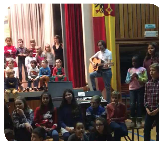
Les élèves de 8P de Collex-Bossy

En cette superbe fête célébrant aussi la fin d'une année 2018 bien chargée, rien, pas même un larsen impromptu sur Imagine de John Lennon, n'a su entamer la bonne humeur des participants.*